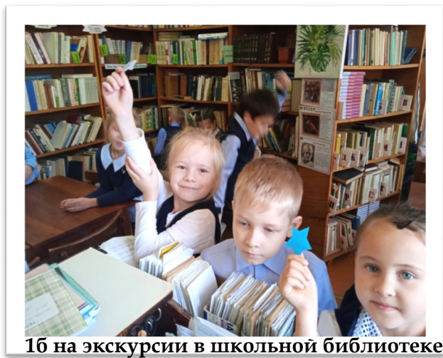
1б на экскурсии в школьной библиотеке