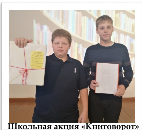
Школьная акция «Книгворот»