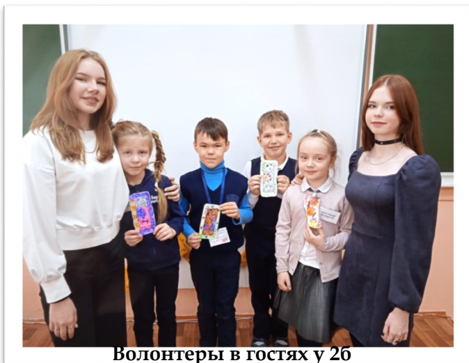
Волонтеры в гостях у 2б