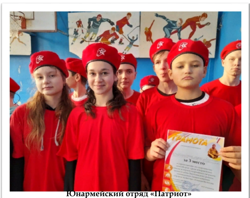
Юнармейский отряд «Патриот»