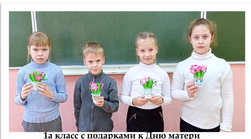
1а класс с подарками к Дню матери