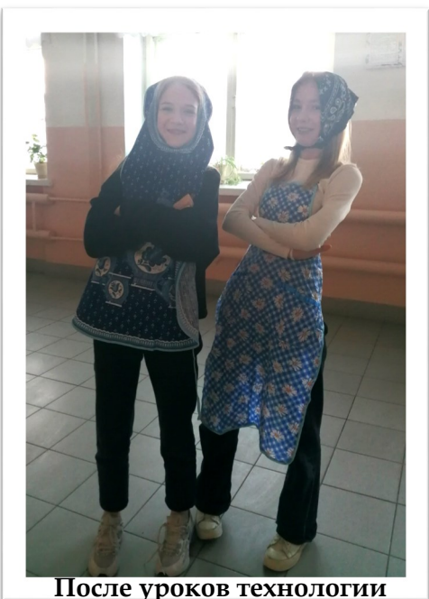
После уроков технологии